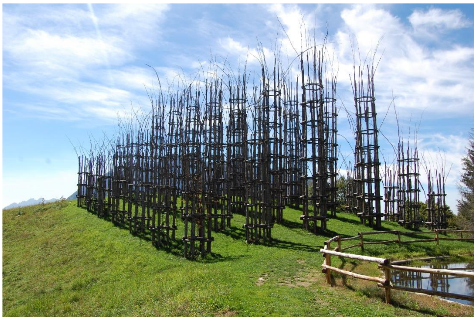
La Cattedrale prima delle tempesta di vento del 2018

Il progetto di Land Art è però ancora vitale: le cinque colonne superstiti sono state ancorate al suolo mentre le piante di faggio sono state riposizionate secondo lo schema iniziale della cattedrale.